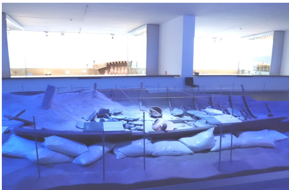
Figura 2 –Acima, pode-se observar a reprodução de um sítio de naufrágio, exposto no Museu Nacional de Arqueologia Subaquática da Espanha (Arqua). Todas as peças desse módulo são reproduções do que foi pesquisado in loco . Na maioria das vezes, salvo por questões de salvamento do sítio, é mais sensato que não se faça a retirada de artefato do meio em que já se encontra estabilizado.

equiparáveis às leis da natureza” (13). Neste sentido, o homem aparece determinado por regras universais, sem participação ativa no processo de mudança cultural, fazendo com que a cultura material fosse vista como um mero reflexo da adaptação ecológica ou da organização política (24). Em sua obra intitulada Interpretación en Arqueología , de 1994, Hodder faz uma interessante abordagem acerca das diferenças existentes entre os paradigmas processualista e pós-processualista.