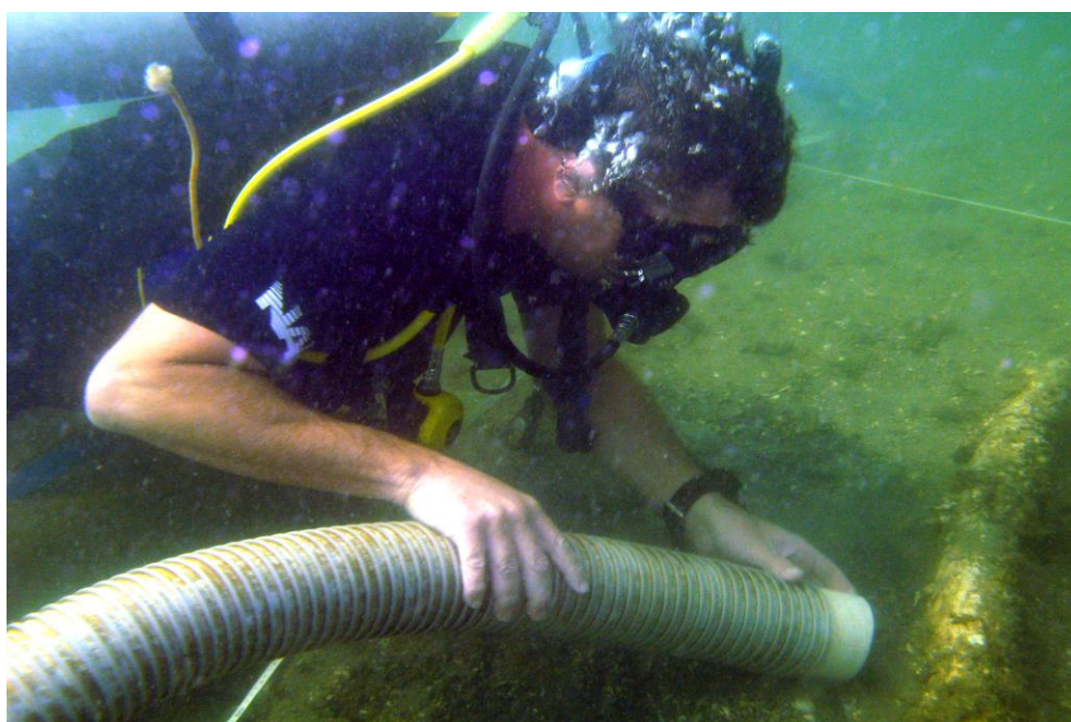
Figura 3 – Atividade de prospecção em um sítio depositário na Enseada da Praia do Farol da Ilha do Bom Abrigo- SP.

corpos d'água, ao longo da história, como cenotes 8 , lagos, rios e mares, os utilizaram não apenas para abastecimento, mas também como lugares de oferendas a suas deidades (15). Alguns desses corpos d'água, mencionados pela pesquisadora acima, formam um tipo de sítio muito semelhante aos sítios depositários e são conhecidos como “sítios santuários”. Nestes sítios, costumam ser encontrados desde artefatos comuns até esqueletos humanos originados de práticas de sacrifício.